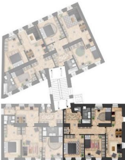
umístění bytu na patře