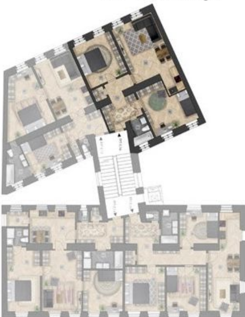
umístění bytu na patře