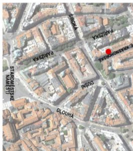
Elišky Krásnohorské 5/12, Praha 1

LEGENDA - Vyháňová šachta - Komunikace - Byt 3 - Balkon 3