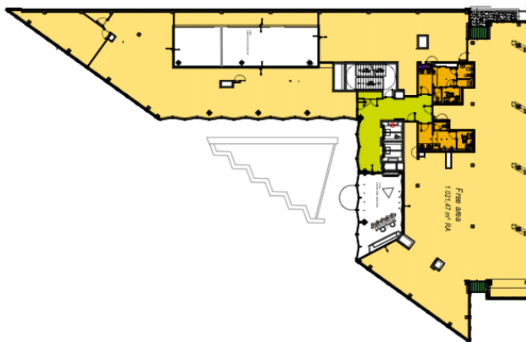
1. patro / 1st floor