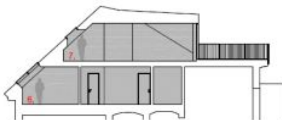
LEGENDA / LEGEND