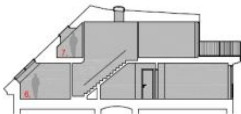
LEGENDA / LEGEND