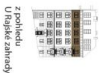
z pohledu U Rajske zahrady