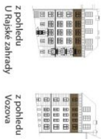
z pohledu U Rajske zahrady