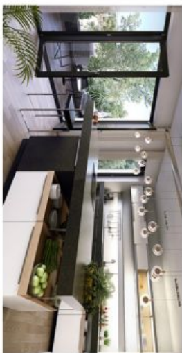
z pohledu Vozova