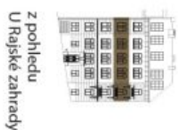
z pohledu U Rajske zahrady