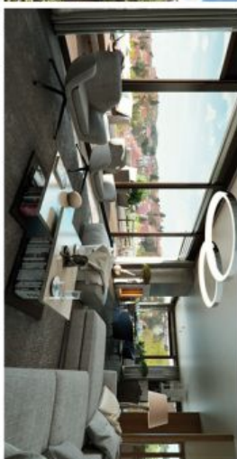
Značkový nábytek nedeformuje rozmístění elektroinstalace v jednotlivých místnostech.