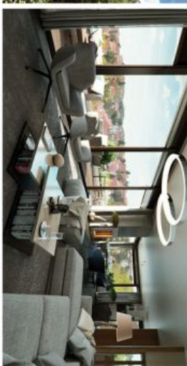
Schéma podorysu bytu představuje předpokládané dispozici řešení bytu. Kuchyňská linka a nábytek nejsou součástí bytu, veškeré zařízení je zobrazováno pouze pro názornost. Značkový nábytek nedeformuje rozmístění elektroinstalace v jednotlivých místnostech.