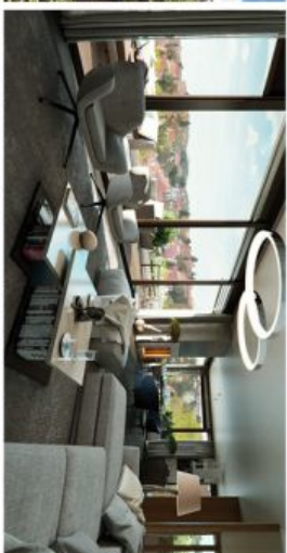
Znašený nábytek nudesňuje rozmištnění elektroinstalace v jednotlivých místnostech.