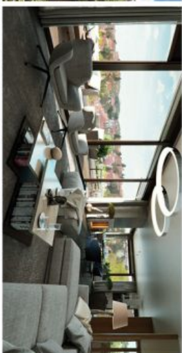
Znašený nábytek nudesfňuje rozmištnění elektroinstalace v jednotkových místnostech.