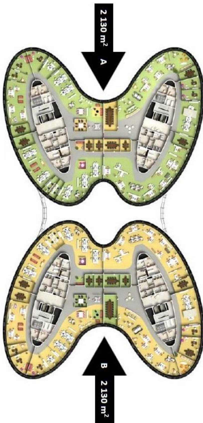
TYPIKÉ PATRO TYPICAL FLOOR