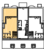
POLOHA BYTU V DOMĚ PŮDORYS 8.NP