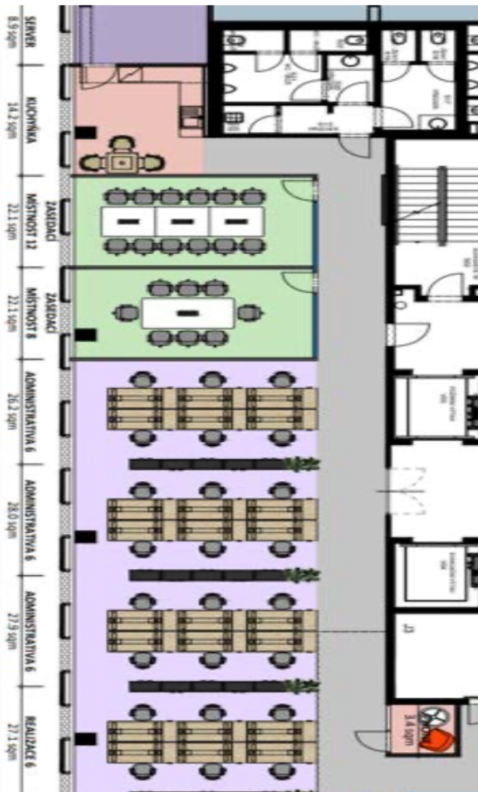
11. patro / 11th floor