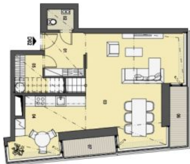
1. PATRO VSTUPNÍ PODLAŽÍ

Složení a detailní vzhled místností: 2 km, resp. 2,6 km v okolí. Názvy popisů a plošné vymezení jsou orientační a neopisují se vzhledem k přístupu a specifikaci v příloze. Zobrazení vzhledu (obrázky, vestavěné skříně, kuchyňské linky, včetně spotřebičů) nejsou součástí dodávky bytu, toto vyznění je zobrazeno pouze pro informaci.