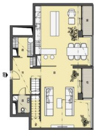
3. PATRO VSTUPNÍ PODLAŽÍ

Složení a měřítko výhledu: 2 km, resp. 2,6 km v okružích. Název popis a plošné vymezení jsou orientační a nepřesné a nezávisí na vyřazení přílohy. Zobrazení vzhledu interiéru, vnitřní stěny, kuchyňské linky, včetně spotřebičů nejsou součástí dodávky bytu. Toto vymezení je zobrazováno pouze pro informaci.