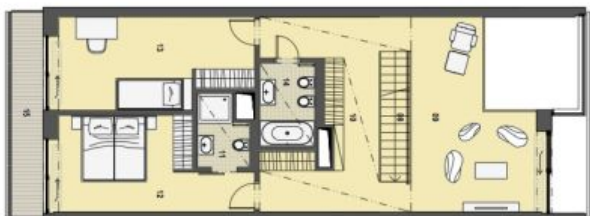
2. PATRO HORNÍ PODLAŽÍ