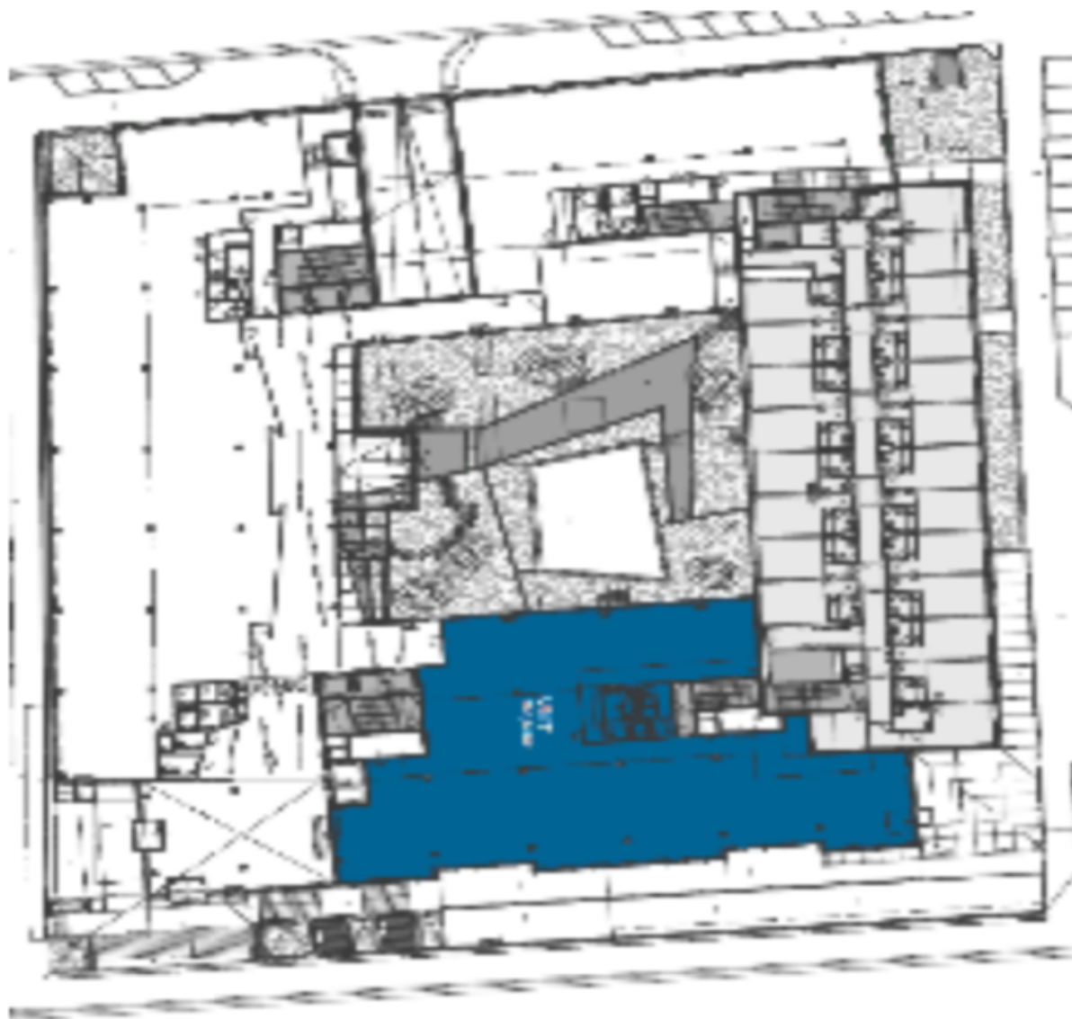
1. patro / 1st floor