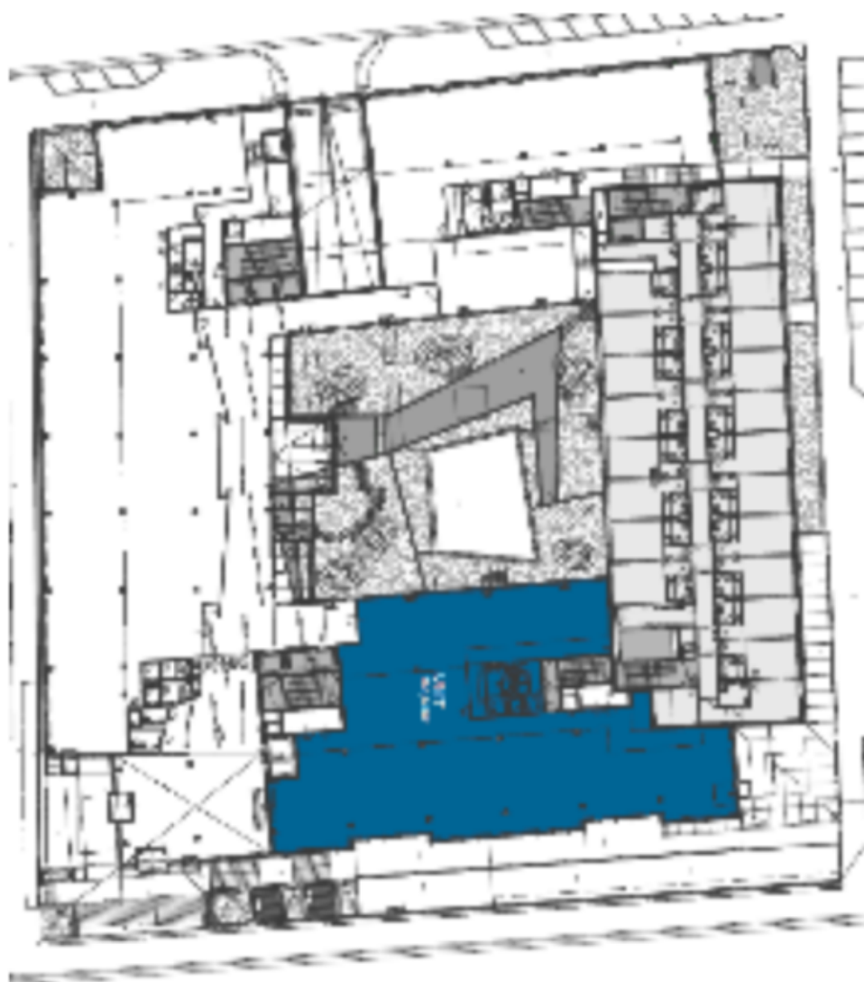
1. patro / 1st floor