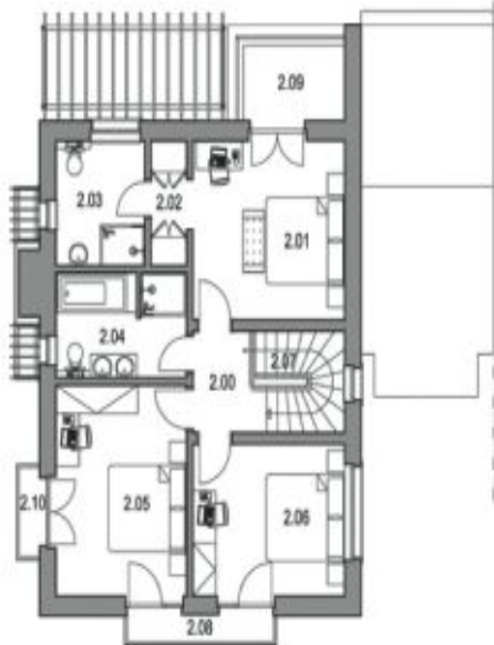
PŮDORYS 2.NP / FIRST FLOOR