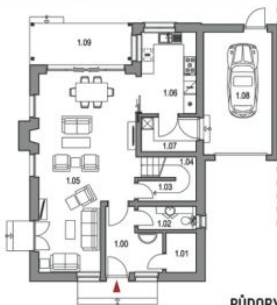
PŮDORYS 1.NP / GROUND FLOOR