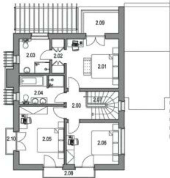
PŮDORYS 2.NP / FIRST FLOOR