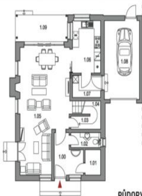
PŮDORYS 1.NP / GROUND FLOOR

plocha domu 156,5 m 2 (vč. garáže), plocha teras a balkonů 17,4 m 2