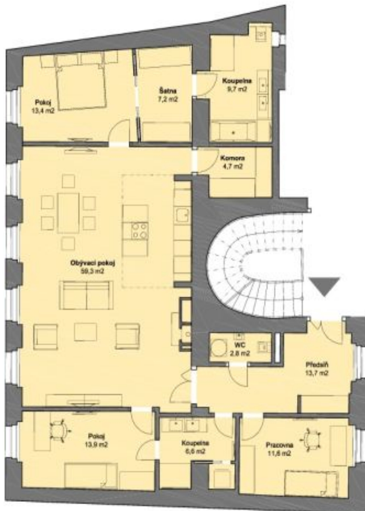
1 : 100 / A4 4.NP