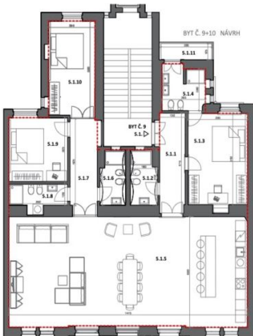
KŘIŽOVNICKÁ 6, STARÉ MĚSTO PRAHA 1 BYT Č. 9+10 NÁVRH