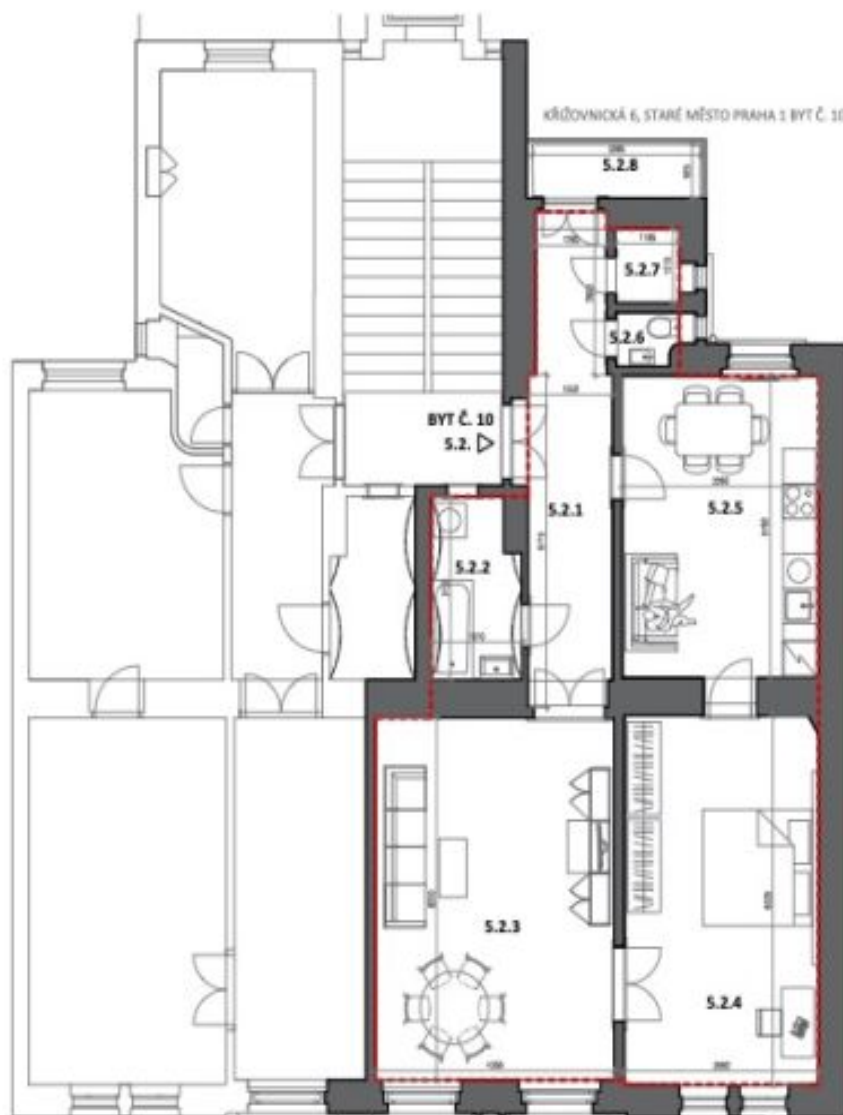
KŘIŽOVNICKÁ 6, STARÉ MĚSTO PRAHA 1 BYT Č. 10 STAVAJÍCÍ STAV