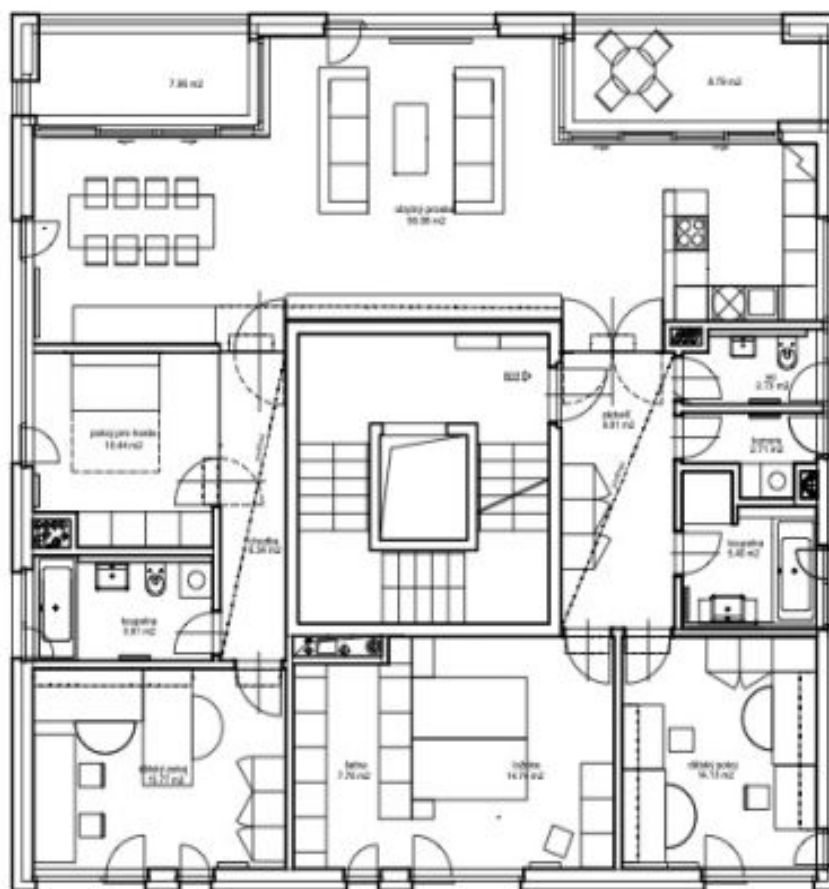
schéma bytu B21+B22 - 2np