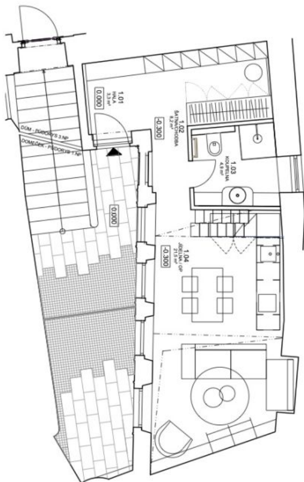
DOMĚČEK - PŮDORYS 1.NP