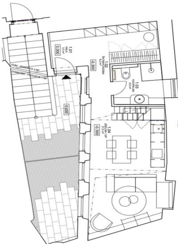
DOMEČEK - PŮDORYS 1.NP