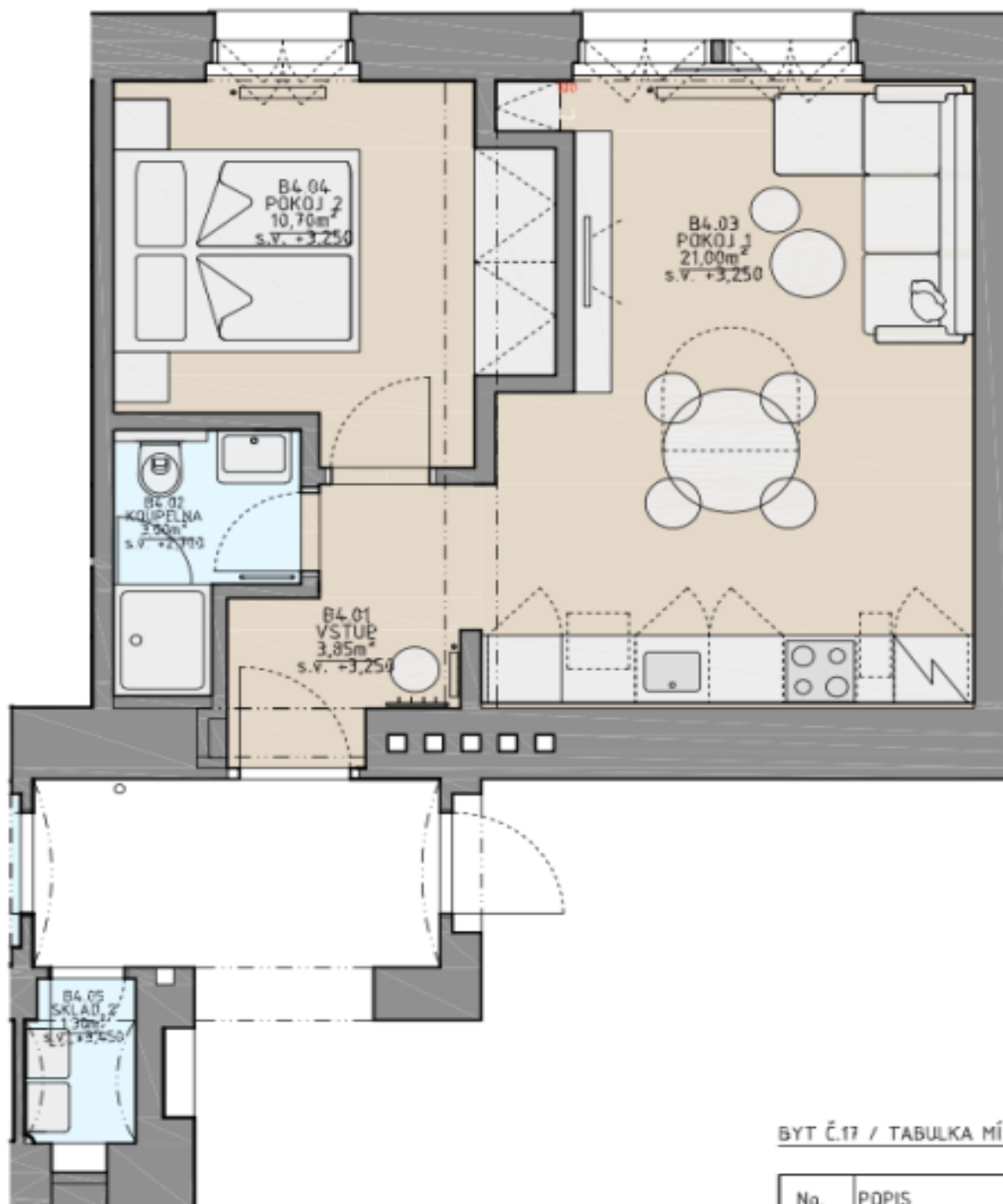
BYT Č.17 / TABULKA MÍSTNOSTÍ