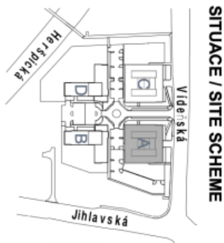
SITUACE / SITE SCHEME