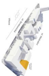
umístění na podlaží