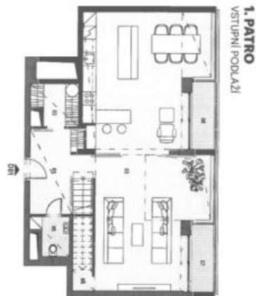
1. PATRO VSTUPNÍ PODLAŽÍ

Byt je v nově vybudované rezidenci. Jde o výhled 2,8 m v rámci Národního územního plánování a jehož součástí je i akce, která má být v rámci územního plánování řešena akcí, která má být v rámci územního plánování řešena akcí, která má být v rámci územního plánování řešena