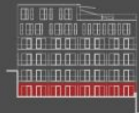
situace bytové jednotky dvorní pohled