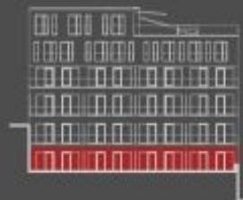
situace bytové jednotky dvorní pořídek