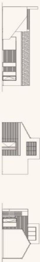
Schéma půdorysu domu představuje dispoziční řešení domu. Kuchyňská linka a nábytek nejsou součástí dodávky domu, zřízení je zobrazeno pouze pro názornost. Specifikace pro konstrukce, povrchové úpravy a rozložení vrbování je předmětem přílohy "Standard nemovitosti". Developer si vyhrazuje právo na změny a upřesnění bez předchozího upozornění.