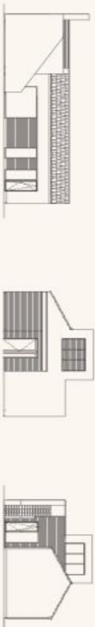
Schéma půdorysu domu představuje dispoziční řešení domu. Kuchyňská linka a nábytek nejsou součástí dodávky domu, zřízení je zobrazeno pouze pro názornost. Specifikace pro konstrukce, povrchové úpravy a rozložení vzhledem k přílohy "Standard nemovitosti". Developer si vyhrazuje právo na změny a upřesnění bez předchozího upozornění.