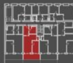
situace bytové jednotky celkový pohled