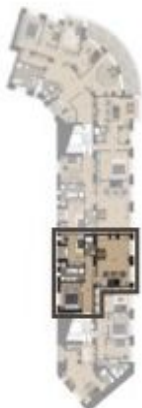
POULUŽÍ / FLOOR