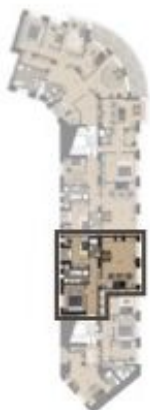
PODLAŽÍ / FLOOR