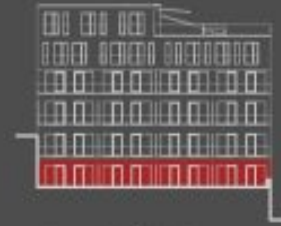
situace bytové jednotky dvorní pohled

upozornění: Tento byt není podrobně drazbovým výjevem a možná určitých odchylek od skutečného provedení je vyhrazeno. Plochy jednotlivých místností jsou pouze orientační. Vytvořena je pouze v příloze bytu (soubor, který není součástí ukázkového bytu). Rozsah služeb je specifikován ve smlouvě. zvláštní výpočet podlahové plochy bytu v jednotce: Dle zákona č. 84/2013 Sb., podlahová plocha bytu ve směru nahlášení vady č.: 366/2013 Sb. - podlahovou plochu bytu v jednotce tvoří podlahová plocha všech místností bytu včetně podlahové plochy všech oválných místností i nerovinných konstrukcí umístěných bytu, jako jsou úhledy, skřepi, páře, kování a skřepované střešní konstrukce. Podlahová plocha je vymezena vnitřním lícem stěnových konstrukcí ohrazených místností včetně jejich přechodových úprav. Doplňkově se také podlahová plocha vztahuje na související přístřešky, jako jsou například úhledy ve stěsně a líců, vstupy a jiné vlnovcové přístřešky ve vnitřní části bytu.