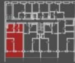
situace bytové jednotky celkový pohled