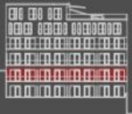
situace bytové jednotky dvorní pohled

upozornění: Tento plán poskytl pouze orientační představu o umístění jednotlivých částí bytu. Jeho skutečnou podobu je nutné ověřit na místě. Pokud některé údaje nejsou zcela přesné, budou upraveny v souladu s reálnou situací. Tyto údaje nejsou zárukou a nemají právní charakter. Všechny údaje jsou poskytnuty pouze pro informaci a nezávisle na ostatních. upozornění: Všechny údaje jsou poskytnuty pouze pro informaci a nezávisle na ostatních. Všechny údaje jsou poskytnuty pouze pro informaci a nezávisle na ostatních. Všechny údaje jsou poskytnuty pouze pro informaci a nezávisle na ostatních.