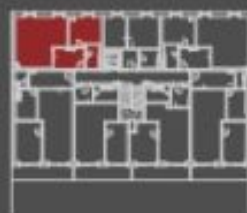
situace bytové jednotky celkový pohled