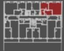
situace bytové jednotky celkový půdorys