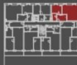
situace bytové jednotky celkový půdorys