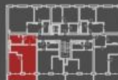
situace bytové jednotky celkový pohled