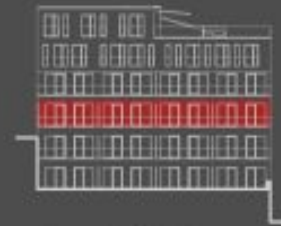
situace bytové jednotky dvorní pohled