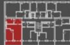
situace bytové jednotky celkový pohled