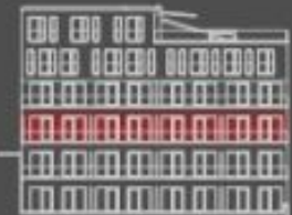
situace bytové jednotky dvorní pohled