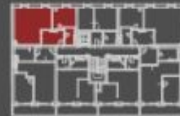
situace bytové jednotky celkový půdorys