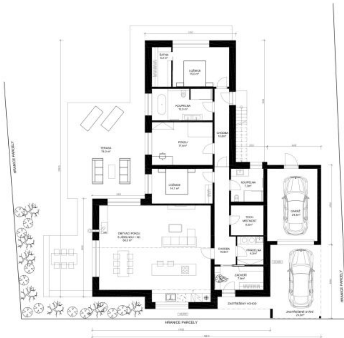
PŮDORYS 1NP - V KONTEXTU PARTERU