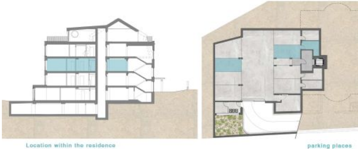
Location within the residence