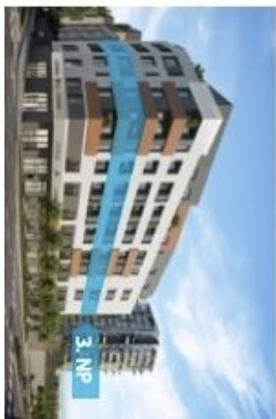
Pohled na dům / Building View