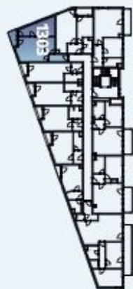
Podlažní podlaží / Floor Plan