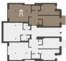
Půdorys podlaží Umístění bytu na pátě