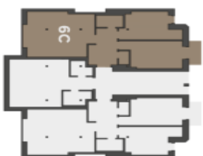
Půdorys podlaží Umístění bytu na patře