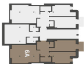
Půdorys podlaží Umístění bytu na pátě