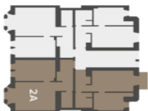
Přidržte podlaží Umístění bytu na patře