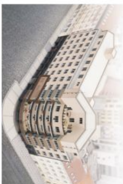
PODLAŽÍ / FLOOR

www.londonhouse.cz , info@londonhouse.cz