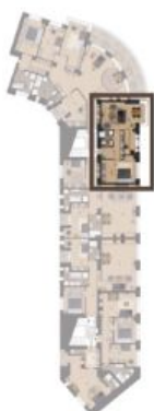
VMĚRA BYTU / FLAT AREA