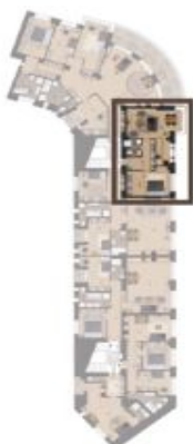
VÝMĚRA BYTU / FLAT AREA