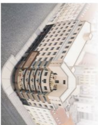
PODLAŽÍ / FLOOR

www.londonhouse.cz , info@londonhouse.cz