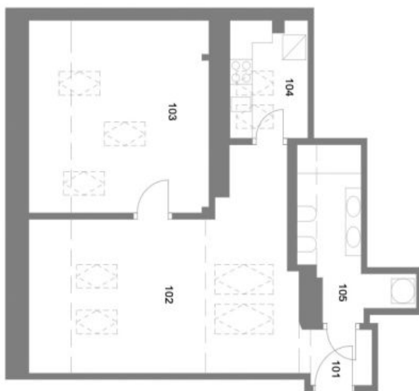
Podlahová plocha celého podkrovní