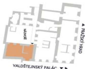
UMÍSTĚNÍ V RÁMCI PATRA