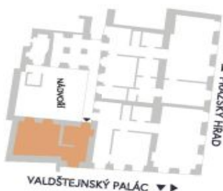
UMÍSTĚNÍ V RÁMCI PATRA