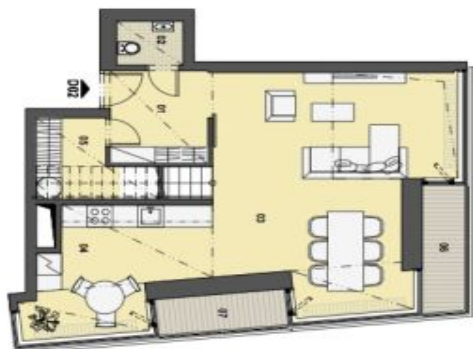
1. PATRO VSTUPNÍ PODLAŽÍ

Srdce našeho města, výhledem na Prahu, 2 km od centra, 2,8 m v šířce, krásný výhled a plně vybavený apartmán s orientací a designem v moderním stylu. Každý byt má vlastní vstupní halu, která je vybavena pro pohodlný vstup a výhledem na Prahu. Každý byt má vlastní vstupní halu, která je vybavena pro pohodlný vstup a výhledem na Prahu.