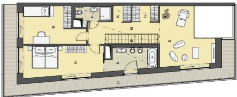
2. PATRO HORNÍ PODLAŽÍ