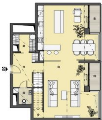
3. PATRO VSTUPNÍ PODLAŽÍ

Smlouba svědčí, výška místnosti 2,6m, vesa 2,8m v anýřích. Názvy prostor a prvků vnitřní jsou orientační a deklarovány si vyřizování jednotky zmeřeny. Zobrazení vybavení nabytkem, vestavěné skříně, kuchyňské linky včetně spotřebičů nejsou součástí dodávky bytu. Toto vyznačení je zobrazeno pouze pro informaci.