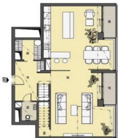
3. PATRO VSTUPNÍ PODLAŽÍ

Srdce našeho města, výhledem na Prahu, vzdálenost 2,6 km, resp. 2,8 km v závislosti na směru. Místy, opatřené s podlahovým vytápěním, jsou orientované a designové. Vytvářejí příjemnou atmosféru. Zdobení vybavení nábytkem, vestavěnými skříněmi, kuchyňskými linkami včetně spotřebičů odpovídá současnému stavu bydlení. Vše, co vyžaduje, je zobrazeno pouze pro informaci.