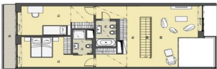
4. PATRO HORNÍ PODLAŽÍ