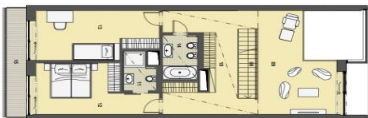
2. PATRO HORNÍ PODLAŽÍ